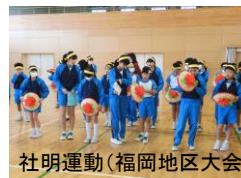
社明運動(福岡地区大会) 優秀作文発表会